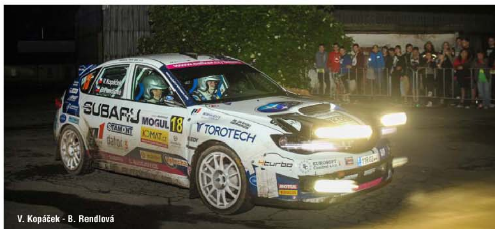
V. Kopáček - B. Rendlová