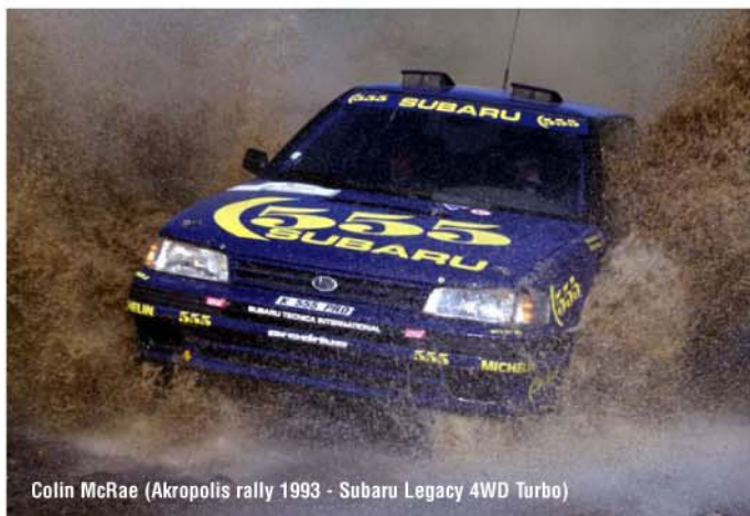
Colin McRae (Akropolis rally 1993 - Subaru Legacy 4WD Turbo)

navzdory problémům s rychlostní skříní a posilovačem řízení pátý. Ve Finsku vylepšil dosud nejlepší výsledek značky Subaru čtvrtým místem Alén. Zatímco v Austrálii opět úřadoval "Kiwi" Bourne (4. místo), Prodrive tvrdě pracoval na zvýšení výkonu motoru a v San Remu poprvé nasadil vůz s hydraulickým mezinápravovým diferenciálem. Jediný vůz Aléna však měl problémy se startérem, finská posádka se propadla až na konec startovního pole a smolnou soutěž zakončila poruchou převodového ústrojí. Na britské RAC Rally Markku Alén naopak exceloval a během první etapy vedl. Druhý den ho bohužel vyřadilo turbo. Hostující pilot Formule 1 Derek Warwick havaroval.