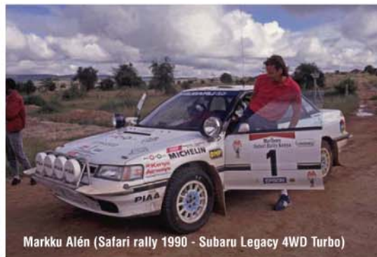
Markku Alén (Safari rally 1990 - Subaru Legacy 4WD Turbo)