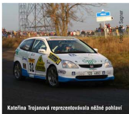
Kateřina Trojanová reprezentovala něžné pohlaví