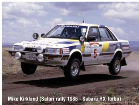
Mike Kirkland (Safari rally 1986 - Subaru RX Turbo)