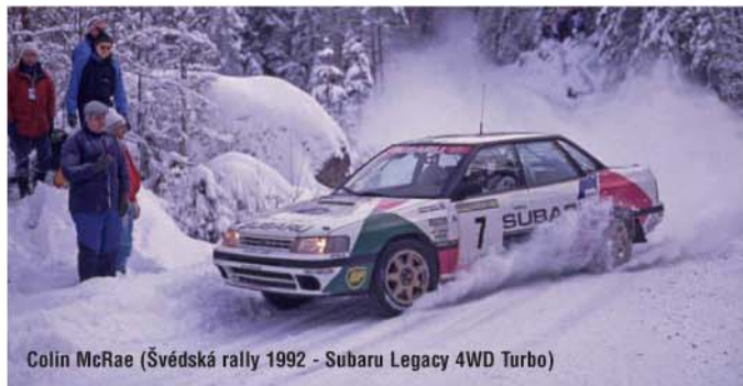
Colin McRae (Švédská rally 1992 - Subaru Legacy 4WD Turbo)